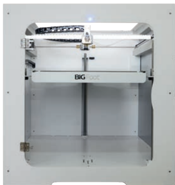
Code art. : 3DP-TUM-BIGFOOT500