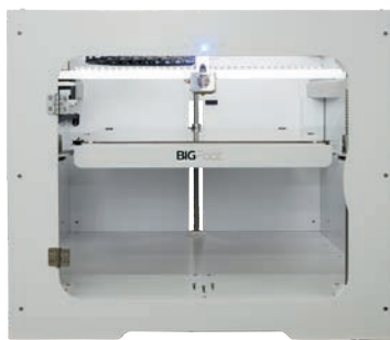
Code art. : 3DP-TUM-BIGFOOT350