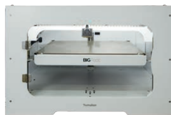
Code art. : 3DP-TUM-BIGFOOT200