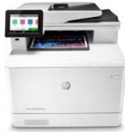
HP Color LaserJet Pro M479dw

Geschäftlich erfolgreich zu sein bedeutet, smarter zu arbeiten. Der HP Color LaserJet Pro MFP M479 ist so konzipiert, dass Sie Ihre Zeit auf eine effektive Unterstützung des Unternehmenswachstums konzentrieren können und gleichzeitig der Konkurrenz einen Schritt voraus sind.