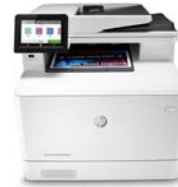
HP Color LaserJet Pro M479fnw

Dieser Drucker ist nur für die Verwendung mit Druckpatronen vorgesehen, die über einen neuen oder wiederverwendeten HP-Chip verfügen. Er nutzt dynamische Sicherheitsmaßnahmen, um Druckpatronen zu blockieren, die einen nicht von HP stammenden Chip aufweisen. Regelmäßige Firmware-Updates erhalten die Wirksamkeit dieser Maßnahmen aufrecht und blockieren Druckpatronen, die zuvor funktioniert haben. Ein wiederverwendeter HP-Chip ermöglicht die Verwendung von wiederverwendeten, wiederaufbereiteten und wiederbefüllten Druckpatronen. Mehr dazu unter: http://www.hp.com/learn/ds