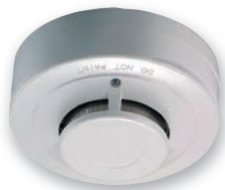
Rauchmelder 7311 / 7312