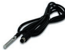
Temperatursensor 7001 (Mini-DIN-Stecker)