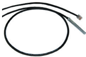
Temperatursensor 7000 (RJ11-Stecker)