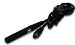
Temp./Luftfeuchte-Sensor 7002 (Mini-DIN-Stecker)