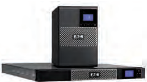
Als Tower- und als 1HE-Rackversion erhältlich