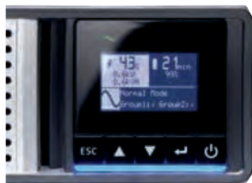
Écran LCD intuitif pour faciliter la configuration et la gestion