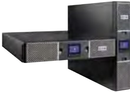
3000 W dans deux unités de Rack seulement (2U) !