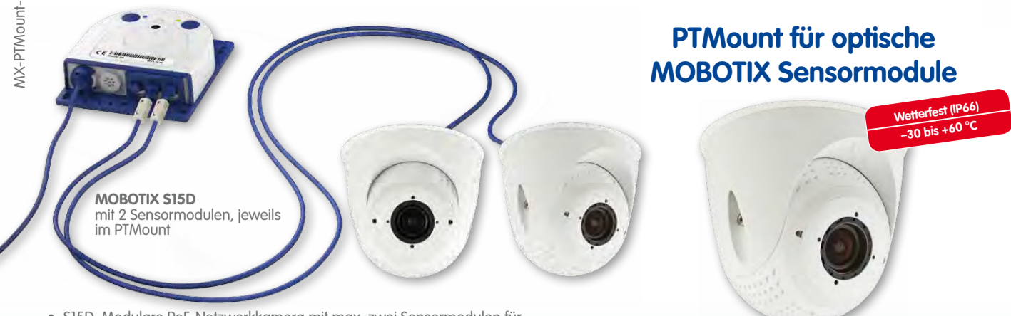
MOBOTIX S15D mit 2 Sensormodulen, jeweils im PTMount