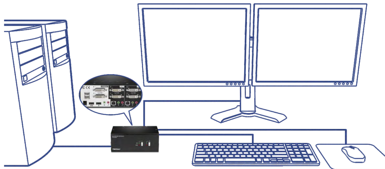
Illustration Eines Network

Zwei zusätzliche USB-Anschlüsse zum Anschluss von Speicherlaufwerken und Druckern.